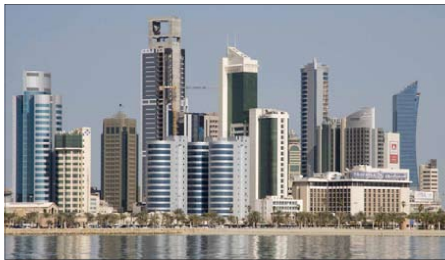
المبيعات العقارية في مارس تسجل أعلى مستوى لها خلال 2014

خلال الأشهر السابقة، الأمر الذي يعكس الانخفاض في عدد الوحدات السكنية المتوافرة في السوق. وأوضح ان الصفقات في محافظة الاحمدي كانت الاعلى بنسبة 34% تتبعها محافظة مبارك الكبير بحصة بلغت 25% وشكلت القسائم 57% من