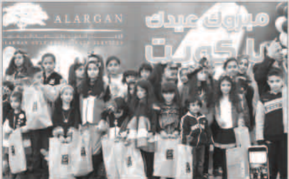
جانب من الاحتفال

التي تؤكد الهوية الوطنية للكويت كما أنها أيضاً تقيني استراتيجية لدعم الفعاليات والأحداث المتعلقة بالاحتفالات الوطنية لمشاركة الشعب الكويتي مناسباته والفرحة الوطنية.