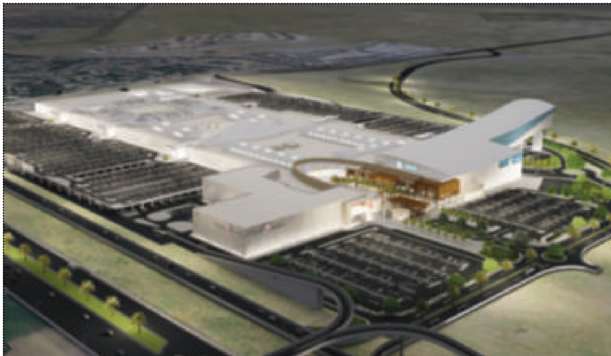
مشروع جاليريا مون فالي

حصلنا على لقب أفضل مطور عقاري للعائد الاستثماري لوحدات مشروع القاهرة الجديدة