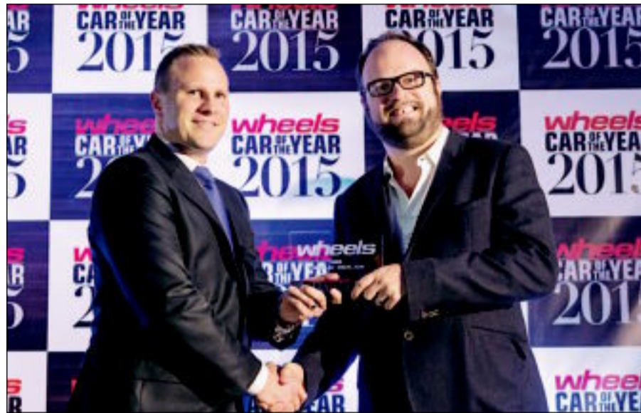
ممثل الشركة متسلماً للجائزة

وذكر ويلر أن «إسكاليد» منذ إطلاقها، أصبحت على الفور الطراز المقياس ضمن الفئة الرياضية متعددة الاستعمالات الفاخرة، بسبب تركيبها التي تجمع التصميم الجري، والقدرات الفائقة، والرحابة الفاخرة القادرة على استيعاب ما يصل إلى ثمانية ركاب، منوهاً إلى أنها تتألق بمعايير التصميم والعناصر التقنية الخاصة بتوسعات الشركة في مجال إنتاج الطرازات المتطورة، لترتقي بمكانتها المتميزة في فئة السيارات الرياضية متعددة الاستعمالات.