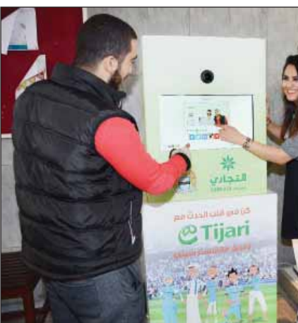
جناح البنك لاقى مشاركة واسعة من الطلاب

منذ انطلاق «جزيرتي» «الجزيرة» تصدر 10000 تذكرة سفر مجانية