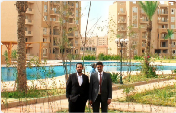
• في موقع مشروع بالم فيو بالقاهرة

خاصة. وأضاف ان اسعار الشقق مناسبة لمختلف شرائح ويبدأ سعر المتر فيها من 4.100 جنيه مصري كامل التشطيبات مع منح العميل مدة سداد 4 سنوات من دون فوائد، وبين ان المشروع جاهز للسكن الفوري. وقال فرغلي ان مجموعة بيرميزا تقدم هدية مجانية لكل مشتر لاحدى الشقق وهي عبارة عن صدق اقامة لمدة اسبوع سنويا ولمدة 15 عاما في اي من منتجعات المجموعة في مصر، والصك يمتاز بتقديم غرفتين فندقيتين لعدد 4 أشخاص، مع منح العميل خصومات اضافية تصل الى 20% على مختلف الخدمات الاخرى التي تقدمها المنتجعات.