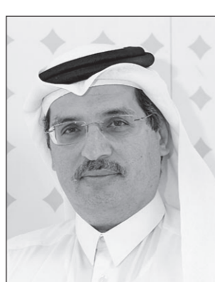
• ناصر معرفية

٣,٥ مليون شخص خلال السنة الأولى منذ إطلاق الخدمة. ومن المنتظر أن توفر أسبائل خدمات ٣G في العراق في يناير ٢٠١٥ خلال شهر من استلامها لترخيص تقديم الخدمة. وفي ميانمار، أطلقت Ooredoo خدمات 3G على نطاق تجاري في أول سابقة من نوعها في العالم، وشهد ذلك طلباً غير مسبوق حيث بلغ عدد العملاء الذين اشتركوا في هذه الخدمة في خلال أقل من ثلاثة أسابيع على إطلاقها مليون عميل. ويستخدم أكثر من ٨٠ بالمائة من عملاء Ooredoo في ميانمار هواتف ذكية، وهو رقم قياسي لإنشاء استخدام الهواتف الذكية في سوق جديد. ونجحت Ooredoo خلال ٢٠١٤ في تبني علامتها التجارية الجديدة لشركاتها، فمع إطلاق العلامة في الكويت في إبريل وفي عمان في نوفمبر ٢٠١٤، أصبحت علامة Ooredoo موجودة في سبع أسواق هي: قطر والجزائر والمالديف وتونس وميانمار وصل عدد عملاء 3G في الجزائر