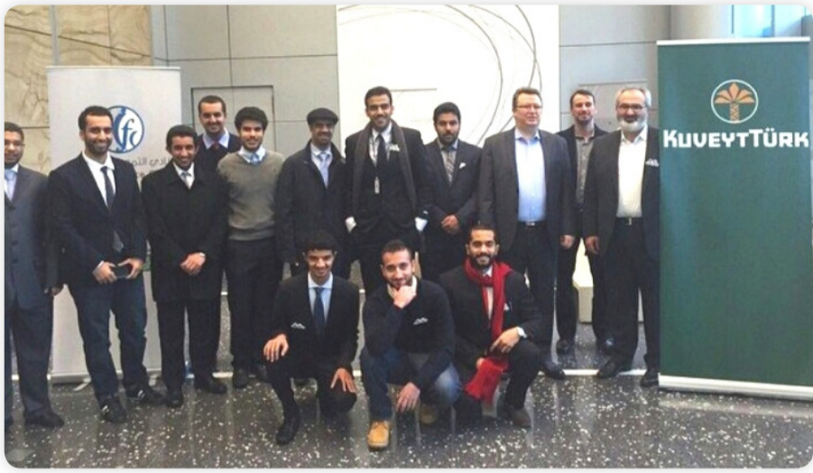
• طلبة الجامعة في فرع «بيتك-تركيا»

مواضيع وممارسات جديدة أسهمت في زيادة وعي الطلبة واثراء افكارهم نتيجة لأهميتها ودورها في تحسين الية العمل ورفع الكفاءة الانتاجية وإبراز دور الاقتصاد الإسلامي. ويحرص «بيتك» على مواصلة دعمه ورعايته لكافة أنشطة النادي من الندوات والمحاضرات المتعلقة بالاقتصاد الإسلامي والمسابقات الثقافية وورش العمل والرحلات العلمية بما يؤكد اهتمام «بيتك» بنشر الثقافة المصرفية الإسلامية وتعزيز الجهود التي تخدم الاقتصاد الإسلامي.