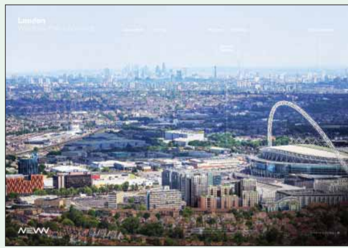
منطقة ويمبلي حيث يقع المشروع