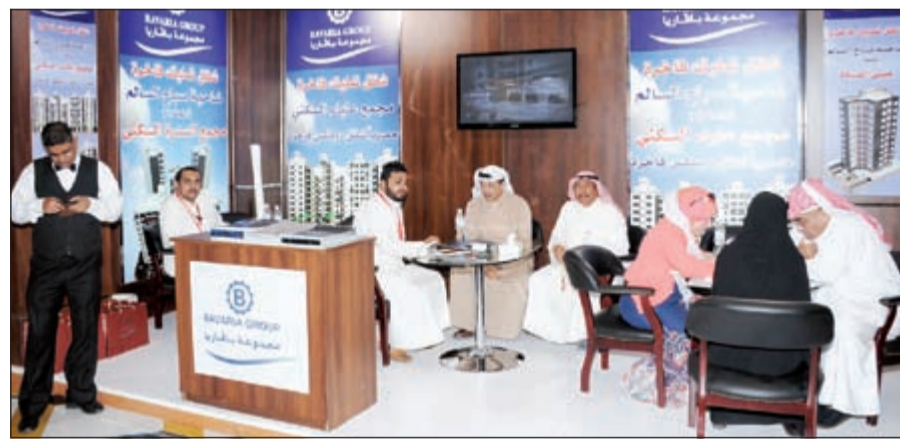
حضور كبير في المعرض

وقال ان المعرض يقدم مجموعة كبيرة ومختارة من أفضل المشاريع الخليجية في دول عديدة، وأيضا تلقى إقبالا من قبل المستثمر الكويتي، ولاسيما تواجد عقارات أوروبية كثيرة تتناسب مع الذوق والمستثمر الكويتي الراغب في الاستثمارات الأوربية بأسعار مميزة.