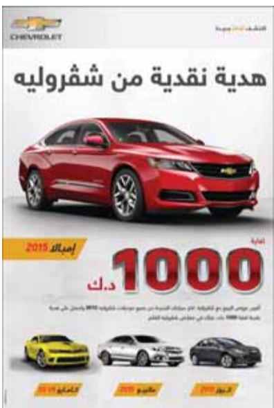
● ملصق العرض الجديد من «شيفروليه الغانم»

أي (فون) واستعراض المقاطع الصوتية المفضلة، مجموعة الصور، الأفلام والبيانات الأخرى المخزنة من خلال تقنية بلوتوث أو USB/AUX.