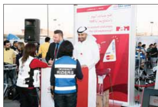
● البنك يعرف الطلاب بمميزات حساب red الشبابي

ويأتي تواجد البنك بهدف تعريف الطلاب بمميزات الحساب، الذي تم تصميمه لاستيفاء متطلبات الشباب الذين تتراوح أعمارهم بين 17 و24 عاماً. ويمكن فتح حساب red بكل سهولة ويسر، حيث لا يتطلب فتح هذا الحساب إيداع أي مبلغ من المال، وهو متاح لحساب توفير مع فائدة شهرية، كما يحظى أصحاب حساب red بعروض وخصومات حصرية لهم لدى أكثر من 150 متجراً في الكويت.