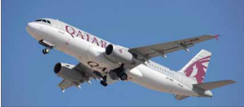
● الخطوط الجوية القطرية تواصل توسيع عملياتها في آسيا وغيرها

أعلنت الخطوط الجوية القطرية مواعيد إطلاق رحلاتها إلى ثلاث وجهات جديدة في باكستان وذلك في إطار استراتيجيتها للتوسع المستمر. اعتباراً من 16 يوليو 2015 ستبدد الناقل الوطنية بتسيير أربع رحلات أسبوعياً إلى مدينة سيالكوت التي ستصبح أول وجهة جديدة في باكستان تطلقها الخطوط الجوية القطرية منذ عام 2004، وتشغل الناقل حالياً ثلاث رحلات شحن أسبوعياً إلى هذه المدينة الباكستانية.