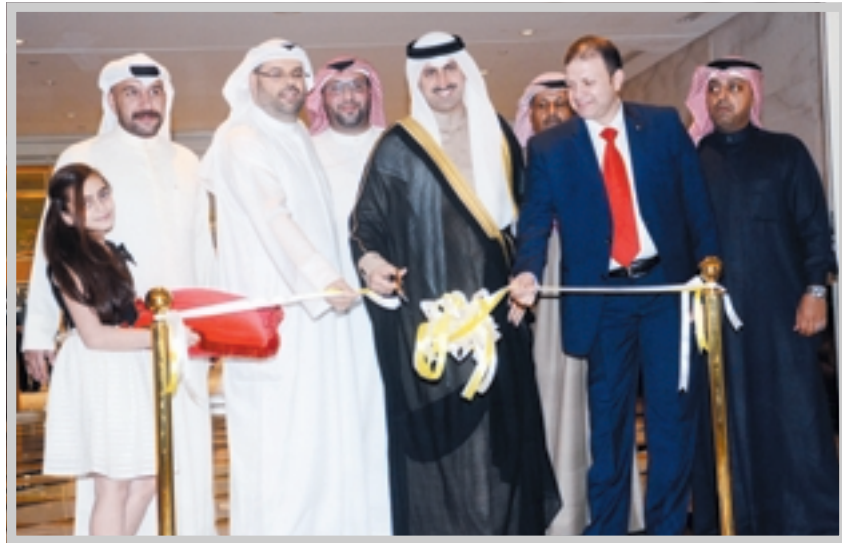
الشيخ نمر الصباح وأحمد الصغار أثناء افتتاح المعرض