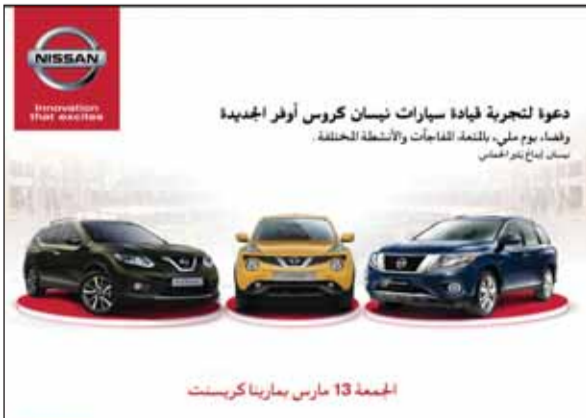
● ملصق دعوة الجمهور إلى تجربة القيادة

تنظم شركة عبد المحسن عبدالعزيز البابطين، والوكيل الحصري والمعتمد لسيارات نيسان في «المارينا كريست» حفلاً في «المارينا كريست»، لتجربة قيادة سيارات الكروس أوفر الجديدة - نيسان «جوك»، نيسان «إكس-تريل»، ونيسان «بائفايندر»، يوم الجمعة الموافق 13 مارس 2015.