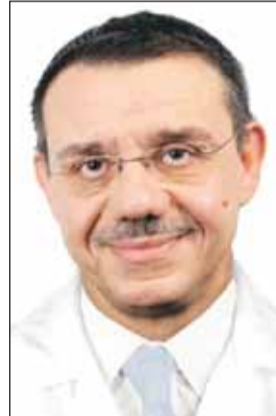
● مارك جيوفانيني

يستقبل مستشفى المواساة الجديد الدكتور مارك جيوفانيني رئيس وحدة التخدير الباطني في معهد باولي - كامبوس بمدينة مرسيليا في فرنسا والرئيس الحالي للجمعية الأوروبية لمناظير الموجات فوق الصوتية ( السونار ) . وهو واحد من أشهر الاستشاريين في أمراض الجهاز الهضمي، كما يعتبر رائداً في تخصص منظار المعدة والأمعاء والقولون ومنظار القنوات المرارية وتحديد منظار الموجات فوق الصوتية، وله أكثر من 200 بحث في هذا المجال. وتستغرق زيارة جيوفانيني ثلاثة أيام من 14 حتى 16 مارس الحالي، ويشرف عليها رئيس قسم المناظير واستشاري طب المناطق الحارة في مستشفى المواساة الجديد الاستشاري محمود عمر. وبهذه المناسبة قال الدكتور محمود عمر إن زيارة الاستشاري جيوفانيني تأتي في إطار برنامج مستشفى المواساة لطبباء الزائرين، والذي يعبر عن حرص إدارة مستشفى المواساة الجديد على الحصول على أفضل المهارات الطبية العالمية والإختصاصات النادرة، لتقدم لمرضاها كل ما هو جديد في تقنيات التشخيص والعلاج داخل الكويت بدلاً من السفر للخارج للحصول على هذه الخبرات الطبية العالمية.