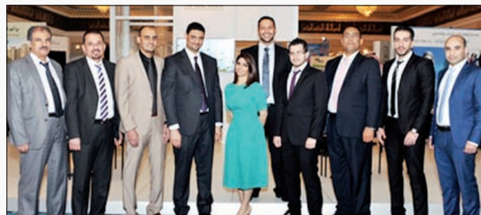
موظفو الشركة أمام جناحها في المعرض

لندن ومحيطها من أكثر من عشرين مشروعاً سكنياً تنفذها الشركة حالياً منها من هو جاهز للتسليم الفوري أو خلال هذا العام. وبين القومى ان أسعار الشقق متفاوتة وتتوافق مع إمكانيات العملاء الراغبين في الشراء والتملك في لندن. من جانب آخر، ستطرح المجموعة أيضاً عددا من الأراضي الاستثمارية في بريطانيا وتقع في منطقة كادنجتون لوتن، وتمتاز الأراضي بموقعها المميز على شارع رئيسي في المنطقة ومحاطة بمنطقة سكنية متكاملة الخدمات. بالإضافة إلى مواقع لعدد من الشركات البريطانية، وأضاف القومى ان إجمالي عدد الأراضي في المشروع يبلغ حوالي 300 قطعة بمساحات تبدأ من 675 متراً مربعاً، وبأسعار تبدأ