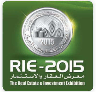
• مشار الشركة

وأشار نجم إلى ان مشروع أركان مول يضم عدة مراحل ويقع في منطقة حيوية ذات كثافة سكانية عالية وغير مخدمة من المشاريع التجارية والحرفية، وتم تنفيذ وفق أسلوب معماري حديث