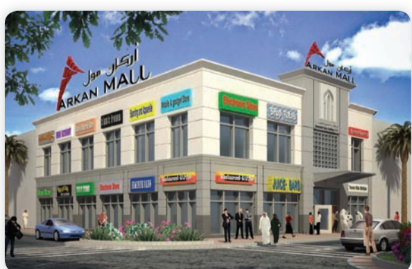
• أركان مول

بنحو 7240 متر مربع وتبلغ المساحات التجارية الاجمالية للمجمع نحو 5600 متر مربع، حيث يضم 238 محلا تجاريا تستهدف أنشطة متنوعة. وأكد ان الشركات العاملة في بناء وتسويق المجمعات التجارية في الكويت ترصد طلبا متزايدا من شركات التجزئة العالمية العاملة في مجالات متنوعة وخصوصا الملابس والأغذية والسلع الاستهلاكية عموما لفتح المزيد من الفروع.