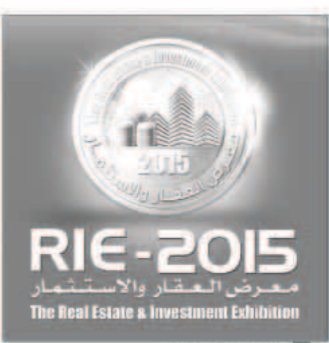
شعار معرض العقار والاستثمار

«دعم» تعد بمثابة أول شركة عقارية تطرح شقق التملك بنظام الإقساط الشهرية لمدة 3 سنوات، كما وأن المشاريع المطروحة ستكون جاهزة للتسليم مع نهاية العام الجاري، حيث سيكون بإمكان العميل إستلام شقته السكنية والإستفادة منها قبل أن ينتهي من سداد كامل الإقساط المستحقة عليه، وقال المهندس المشاريع التي تطرحها الشركة نظراً بمواقعها الإستراتيجية، حيث يطل أحد هذه المشاريع على الشريط الساحلي بمنطقة الميولة، فيما يقع المشروع الآخر في المناطق السهلية والتي تعتبر أكثر المناطق حيوية وجاذبية.