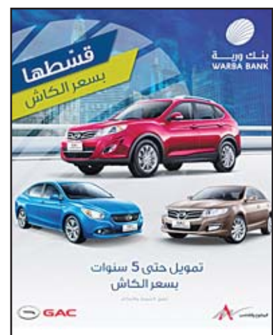
A flyer of the event

Through this partnership, Warba Bank's customers are now able to purchase their favorite cars from "GAC Motors" with a financing service for up to five years at the cash price. Moreover, customers will receive distinctive advantages including eleven-year warranty, free car registration at