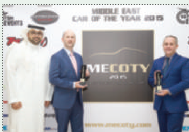
التزام «جاكوار» بأفضل تجارب الأداء

أعلنت شركة جاكوار المتخصصة في صناعة السيارات الفاخرة عن فوزها بجائزة مرموقة في عالم السيارات خلال النسخة الثانية من حفل توزيع جوائز سيارة العام في الشرق الأوسط (MECOTY)، الذي أقيم يوم الأربعاء الموافق 29 أكتوبر 2015. حيث فازت سيارة جاكوار XE الجديدة بجائزة «أفضل سيارة سيدان تنفيذية مدمجة» للعام 2015، بعد منافسة قوية مع مجموعة من أبرز السيارات في القطاع، وبفضل تصميمها الذي يجمع بشكل مثالي بين مقود سريع الاستجابة مع مستويات عالية من الراحة والنقاء والأداء الفائق، استحوذت جاكوار XE على اهتمام كبير منذ إنطلاقها، وتواصل تعزيز مكانتها في منطقة الشرق الأوسط. وتشتهر جاكوار XE في فئتها باعتبارها السيارة الخالية للساناقين، وتعتبر دليلاً حياً على التزام جاكوار بتقديم ديناميكيات قيادة مبتكرة وأداء لا يعلى عليه.