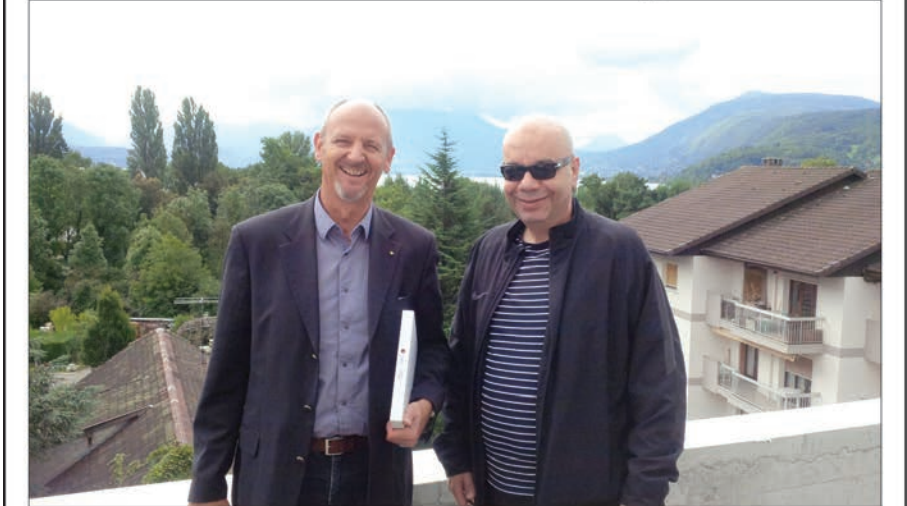
القرومي ورئيس الشركة اليفيغيا في زيارة لأحد المشاريع

الراهنة في عدة مدن وقرى تعمل الشركة فيها من أبرزها Anney-le-Vieux, Veigy- Foncenex, Ornex واضح القرومي بأن المشاريع عبارة عن بنائات سكنية تتألف من عدة شقق من غرفة إلى أربع غرف نوم ومنافعها وتمتاز أيضاً المباني بقرتها من مراكز الخدمات في المدينة بالإضافة إلى جودة البناء والتشطيبات والتي امتازت بها الشركة المطورة بمختلف مشاريعها. وبين قرومي بأن التملك في تلك المشاريع تملك حر وللمختلف الجنسيات مشيراً إلى أن أسعار الوحدات تبدأ من 200 ألف يورو وستكون معظمها جاهزة للسكن منتصف العام 2016. وقال القرومي إن أهل الخليج كانوا من السابقين بالتملك منذ السبعينيات في هذه المناطق ومناطق أخرى مثل ديفون وأيفيان وغيرها. وبين أن هذه المناطق ما زالت تستقطب فئة معينة ومحددة ومميزة من المستثمرين الذين يقدرون قيمة هذه المناطق والسكن فيها حيث يقضي معظمهم أوقاتاً طويلة للإقامة فيها سواء في فصل الصيف أو الشتاء وبين القرومي أن المجموعة تسعى من خلال تسويق هذه المشاريع في المنطقة إلى استقطاب هذه الشريحة المميزة من المستثمرين.