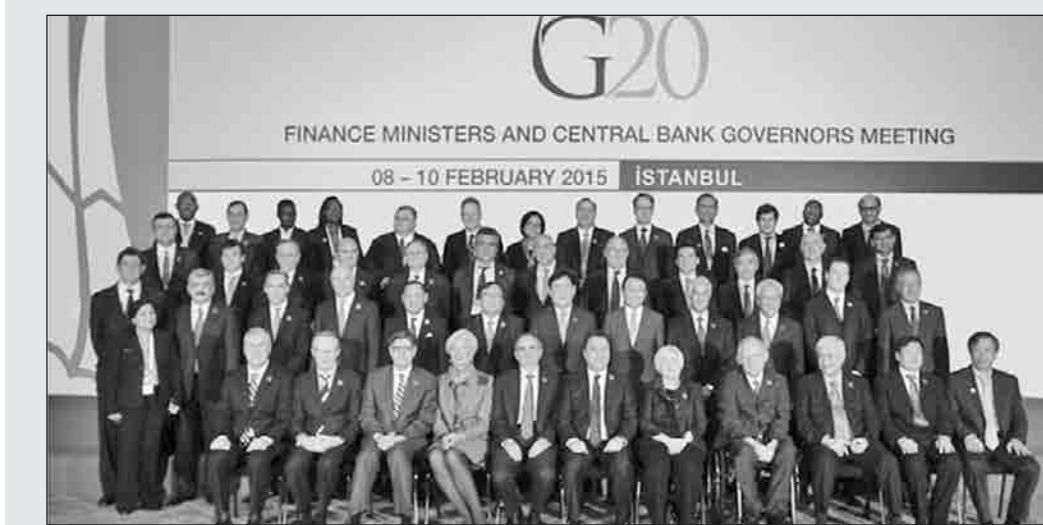
* قادة مجموعة العشرين

وقالت بريكس في بيان بعد الاجتماع يبرز هذا