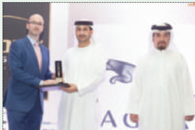
جائزة أفضل سيارة لجاكوار