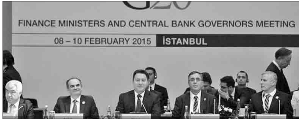
* جانب من قمة العشرين في تركيا

وقال الشيخ إن دول الخليج نحو فرض ضريبة للمبيعات أجاز إن دول الخليج بدأت بدراسة فرض هذه الضريبة منذ فترة إلا أن تطبيقها بالتأكيد سيكون تدريجياً، بسبب تفاوت الدخل.