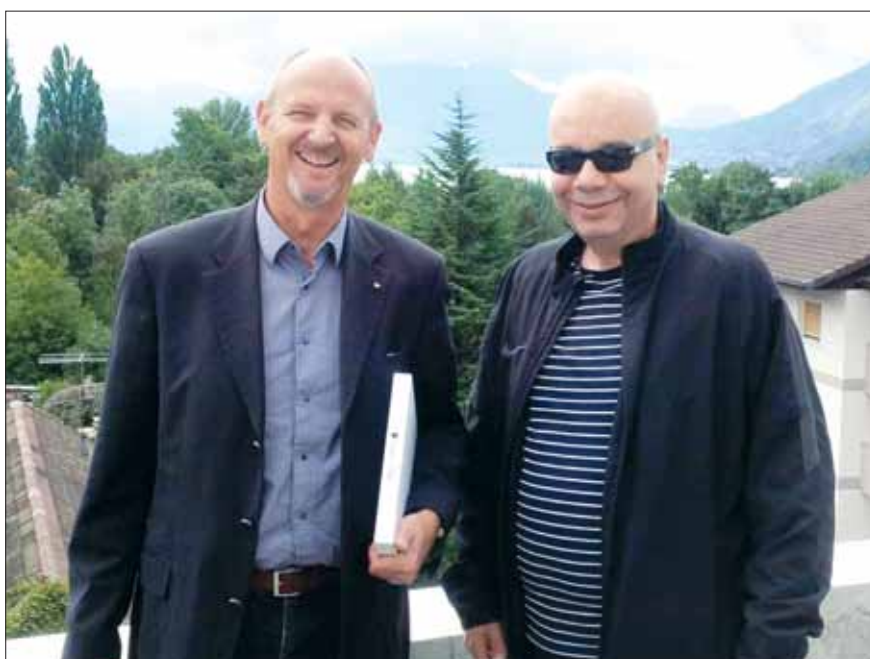
• القدمي ورئيس شركة أوليفيا في زيارة لأحد المشاريع

الراهنة في عدة مدن وقرى تعمل الشركة فيها Omex وأضاف القدمي أن المشاريع عبارة عن نباتات سكنية تتألف من عدة شقق من غرفة الى اربع غرف نوم ومنافعها، وتمتاز أيضا بالمباني بقرتها من مراكز الخدمات في المدينة، بالإضافة الى جودة البناء والتشطيبات التي امتازت بها الشركة المطورة لمختلف مشاريعها. وبين القدمي أن التملك في تلك المشاريع تمك حر ولختلف الجنسيات، مشيراً الى أن أسعار الوحدات تبدأ من 200 الف يورو وستكون معظمها جاهزة للسكن منتصف عام 2016.