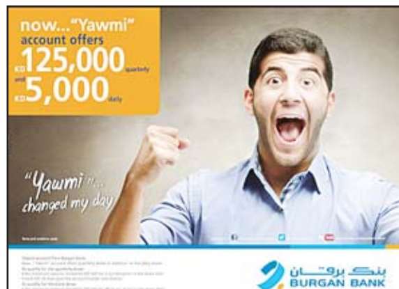
A flyer of Burgan Bank's Yawmi Account promotion.