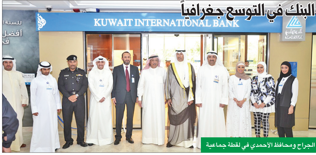
الجراح ومحافظ الأحمدى في لقطة جماعية

الجراح: انسجاماً مع استراتيجية البنك في التوسع جغرافياً