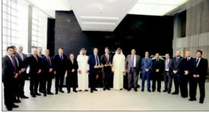
مسؤولو «البابطين» يكرمون وفد «إنفينيتي»