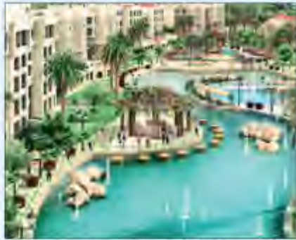
مخطط المدينة السكنية في جزيرة النخيل والتوسعة

وقال إنه خلال الأشهر الستة الماضية استكون الأزمة قد اقتضت عدم تأثر على شريحة كبيرة من الممولين فهناك من سأل إن يملك التمويل، لكنه قال إنه يجب بالتحديد أن تصمد قوانين إحدى الجهات العالمية الخاصة في مثل هذه الظروف، والقوانين التي جعلت قضايا التمويل والتكافؤ في الكويت، حيث أكد على أنه يجب أن يتم إعادة النظر في هذه القوانين ضمن سياسة الإصلاح النظام المصرفي والمالي