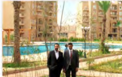
• في موقع مشروع بالم فيو بالقاهرة

مناطق للخدمات العامة والحدائق وحمامات السباحة، ويتألف من 12 بناية سكنية وإجمالي 288 شقة سكنية بمساحات 2-3 غرف نوم بالإضافة إلى وحدات دوبلكس بمساحات 275 حتى 350 مترا وبحدائق