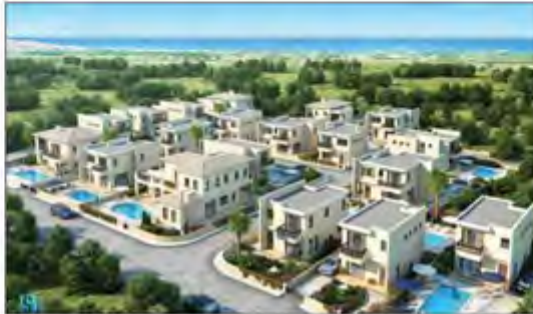
● الربيف الأزدي

وقالت إن أبراج اليوستي تميزت خلال سنوات عملها السابقة بالشفافية السوية وبطووس والمصداقية في مواعيد التنفيذ والتسليم، أما في ما يتعلق بمشروع أبراج اليوستي 8 فلغات إن الشركة حرصت على زيادة مواقف السيارات.