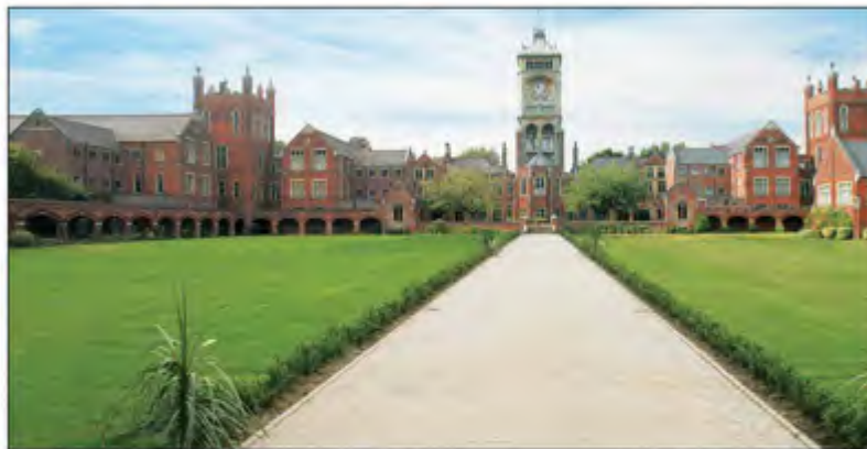
مشروع رويال كويت بارك

أعلنت مجموعة توب للتسويق العقاري مشاركتها ورعايتها الذهبية لمعرض قطر الدولي للعقار والاستثمار الذي تنظمه مجموعة عبر القارات للمعارض والتزعم إقامته في مركز قطر الدولي للمعارض بالدوحة خلال الفترة 3-6 مارس المقبل، حيث ستشارك المجموعة بعدد من المشاريع العقارية المميزة من الإمارات والأردن وبريطانيا.