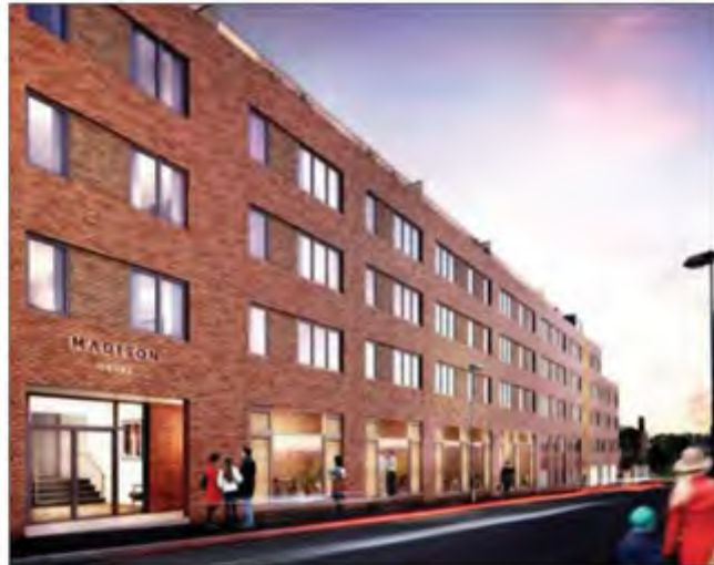
تأخذ المشروعات الاستثمارية

الأمم في برمنجهام. ازدهرت مدينة برمنجهام كموقع جاذب للاستثمار في العقارات السكنية باعتبارها ثاني أكبر مدينة بعد لندن. وكانت عملية تجديد العقارات تدريجية خلال العقد الماضي مع تعافي برمنجهام من الانهيار الشديد في أنشطة التصنيع في الثمانينيات. ارتفعت الأسعار فعلياً بصورة قوية تماماً في معظم الأحياء ومن المتوقع أن تستمر في الارتفاع خلال السنوات القادمة مدفوعة بإعلان الحكومة البريطانية عن خططها الطموحة لتطوير البنية التحتية في وسط المدينة من خلال ضخ حوالي 4 مليارات جنيه إسترليني لتطويرها. وأضاف يجب على المستثمرين الراغبين في شراء العقارات بغرض الإيجار أن ينظروا إلى برمنجهام وأن يتعدوا عن إيجارات لندن المرتفعة لصالح العوائد المرتفعة، طبقاً للإباحت ذات الصلة.