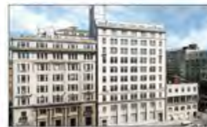
مشروع ستراند في ليفربول.