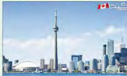
• تورنتو من الفضل من العالم للعين والاستثمار

واضاف: «ستطرح خلال معرض الكويت الدولي كذلك مشاريع مميزة من كل من تركيا واسبانيا، ويسرني أن أعلن من قيامنا بعقد تحالفات استراتيجية مع شركات عمانية وتركية وسنطرح خلالها الصورة قبل نهاية العام الجاري»