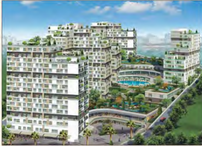
● مشروع تيراس مكس

والأكبر القدومي ان تيراس مكس يعد فرصة حقيقية للاستثمار الناجح. وحول المشروع قال القدومي انه يتألف من 5 مبان متعددة الادوار لغاية 15 دورا، منها 3 مبان سكنية و مبانين سكنيان تجاريان. وتنوع الشقق فيها من استوديو 1، 2، 3 غرف نوم بتشطيبات عالية الجودة. وأشار الى ان المشروع يتوافر فيه الخدمات المتكاملة من حدائق وملاعب وناد صحي، ومواقف سيارات وخدمات صيانة وامن على مدار الساعة. وحول اسعار الوحدات السكنية قال القدومي ان اسعارها مناسبة لمختلف الفئات وتبدأ من 18 الف دينار كويتي وتسهيلات بالدفع تصل لغاية 30 شهرا. وأشار القدومي الى ان المشروع يبعد حوالي 18 كيلومترا من مطار اتانورك، ويبعد حوالي 31 كيلومترا عن منطقة تقسيم وشارع الاستقلال، بالإضافة الى ملاصقة المشروع لشبكة الطرق الرئيسية في المدينة وسهولة الوصول اليه ايضا من خلال المتروباص، الذي يعد وسيلة النقل الاسهل في المدينة والتي لا تتأثر بالزحام اطلاقا. وبين القدومي ان المشروع قيد الإنشاء والتسليم في اكتوبر 2014. وأكد القدومي ان الشركة المطورة عند الانتهاء من تنفيذ المشروع وتسليم الوحدات السكنية لأصحابها ستعمل على استخراج تلك الوحدات من ملاكها لمدة سنتين، ومنحهم عائدا ايجاريا سنويا 7% من قيمة الوحدة. من جانب اخر، قال القدومي ان المجموعة وشركة انانلار تدرسان حاليا تأسيس شركة متخصصة بإدارة العقارات في تركيا، لتتولى مستقبلا ادارة عقارات المشترين والمستثمرين من المنطقة الراغبين بذلك، في خطوة تهدف الى تسهيل امور الملاك الجدد ومتابعة عقاراتهم والمحافظة عليها وضمان تحقيقهم عوائد مميزة في المستقبل.