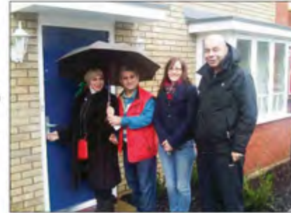
• جانب من التسليم