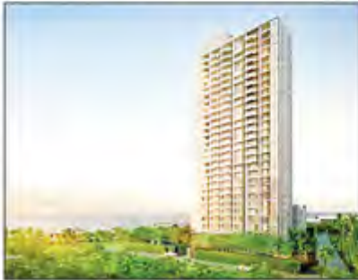
(Top & above): Thailand real estate projects