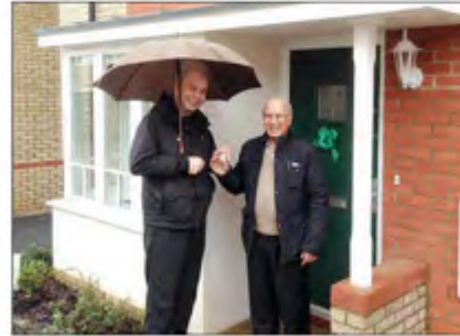
• وجانب آخر

» القدومي: ميزة في جيرة مناسبة وأفضل تواصل اجتماعي «