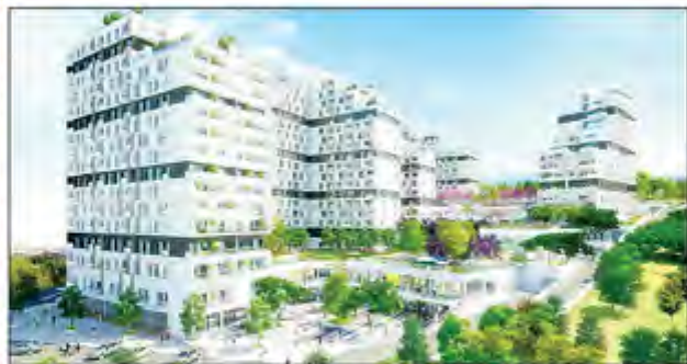
Terrace Lotus in Beylikduzu