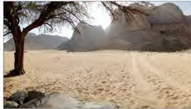
مشروع العمارة السكنية في الأردن