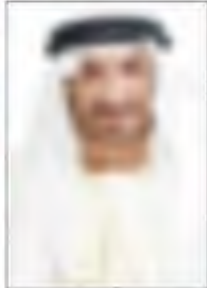
• حارب العربي

قال مدير تطوير الاعمال في تركيا مجموعة توب العقارية ليكوت اكسو: