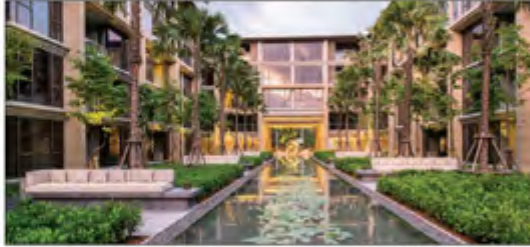
أحد مشاريع الشركة في تايلند