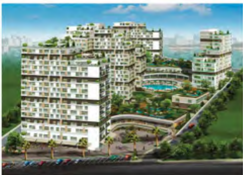
Terrace Mix Project