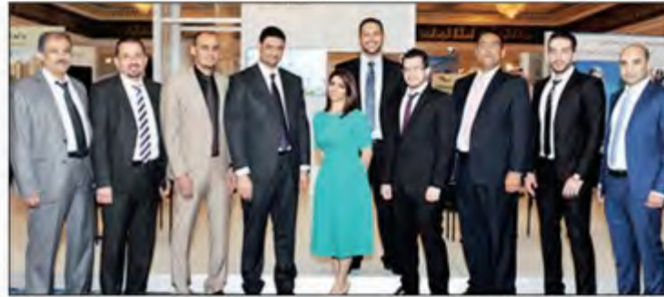
موظفو الشركة أمام جناحها في المعرض