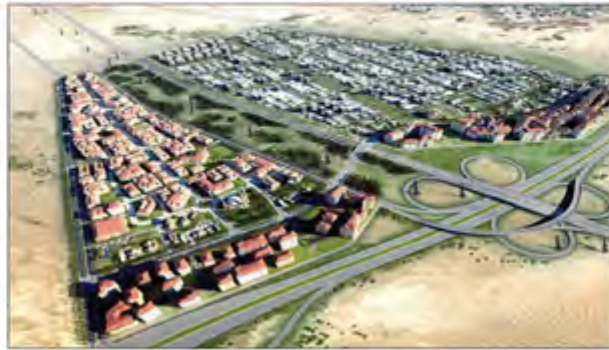
أحد المشروعات في إمارة الشارقة